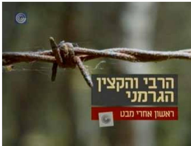
„דער חבֿ"ד רבי און דער דייטשישער אַפֿיציר“

באַשעפֿטיקט אין „אַבווער“ מיט עקאָנאָמישן שפּיאַנאַזש. דער שעף פֿון „אַבווער“, אַדמיראַל קאַנאַריס, האָט געהאַלטן פֿון אים און אויסגעפּוועלט ביי היטלערן אַ דערלויבעניש צו האַלטן אַ „מישלינג“ אין זיין דינסט. אין 1943